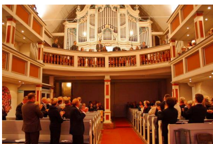
Stimmungsvolle Begeisterung für das Freiburger Bachensemble

Am 3. Mai begannen die Lux Festspiele 2014 in der Concordia-Kirche zu