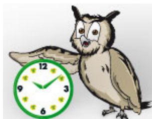
Erlebnis-Umwelt-Tour von Kaufland mit Uhu Ben

Letzteren findet man bereits seit fünf Jahren im Sortiment von 14 Kaufland-Häusern zwischen Eisenach, Erfurt, Suhl und Jena. Kaufland unterstützt mit Filialplakaten und Beiträgen in seiner Kundenzeitung mit Erfolg die vom Naturpark Thüringer Wald entwickelte und seit 2003 vertriebene regionale Vorteilskarte. Ein überzeugendes Beispiel, wie eine Partnerschaft zwischen einem bundesweit agierenden Handelsunternehmen und eines auf Tourismus und regionaler Wirtschaftsförderung ausgelegten Naturparkprojekts zu beiderseitigem Vorteil funktionieren kann.